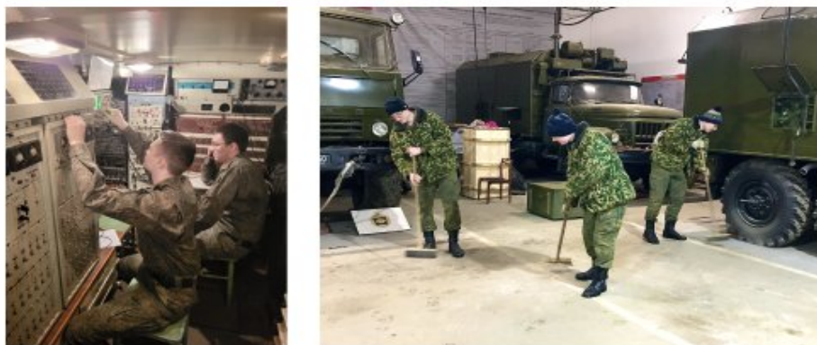
РАБОТА СО СТАНЦИЯМИ И ОБСЛУЖИВАНИЕ ПАРКА