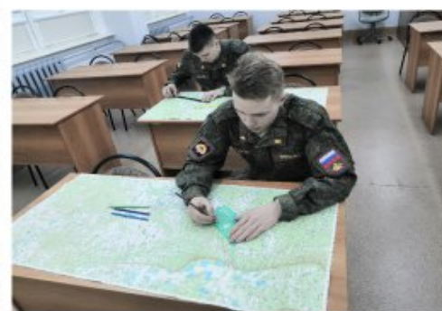
ПОДГОТОВКА К НОРМАТИВАМ И РАБОТА С КАРТАМИ