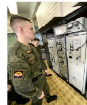
ВЫПОЛНЕНИЕ ЗАДАЧИ № 14